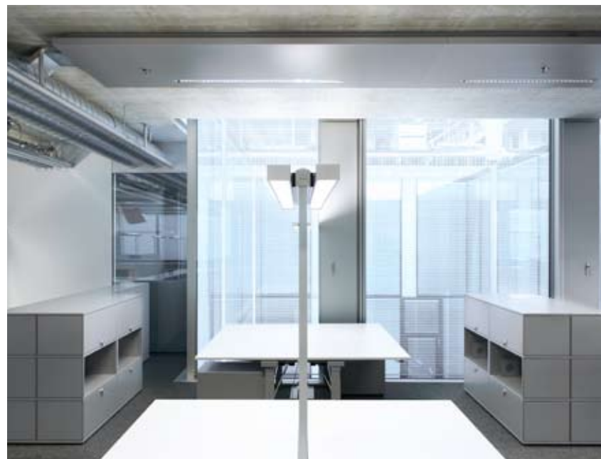
Zum Lichthof orientierte Arbeitsplätze Postes de travail orientés vers la cour intérieure